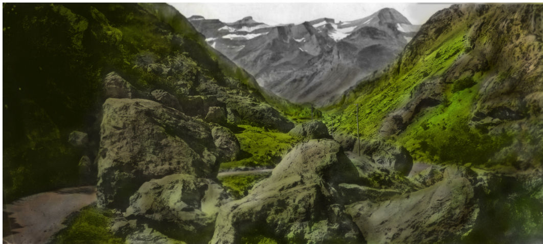
Sans titre, image recolorisée © David Coste Image destinée à tapisser un des murs de l'espace des arts

Les créateurs d'utopies rêvent d'une société idéale et évoquent dans leurs récits des mondes parfaitement heureux. Leurs différents récits font référence à une société harmonieuse tant sur le plan des castes qui la composent que sur leur structure architecturale. Une rationalisation de l'espace et des fonctions sociales des personnes composant cette société est selon leurs auteurs nécessaires au bon fonctionnement de ces sociétés modèles. Ses règles garantissent, selon les différentes versions des utopies, une harmonie interne mais aussi une forme de protection contre des envahisseurs potentiels. En effet, ces sociétés sont souvent protectionnistes et comme c'est le cas dans le modèle de cité évoqué par Platon, elles excluent toute une partie de la population. Les envahisseurs potentiels évidemment mais aussi les infirmes, les handicapés. L'aspect protectionniste de ces sociétés est aussi évoqué par Thomas More, inventeur du terme d'utopie au milieu du 15ème siècle. L'environnement insulaire qu'il propose est naturellement protégé par l'eau et les montagnes qui le ceignent, site d'une société idéale, suffisante (autarcique). De plus cette configuration géographique confère une protection supplémentaire aux habitants car le lieu est inconnu des envahisseurs, ce qui la place au rang de mythe de non lieu. »